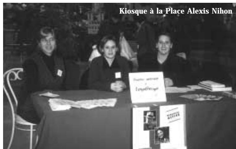
Kiosque à la Place Alexis Nihon