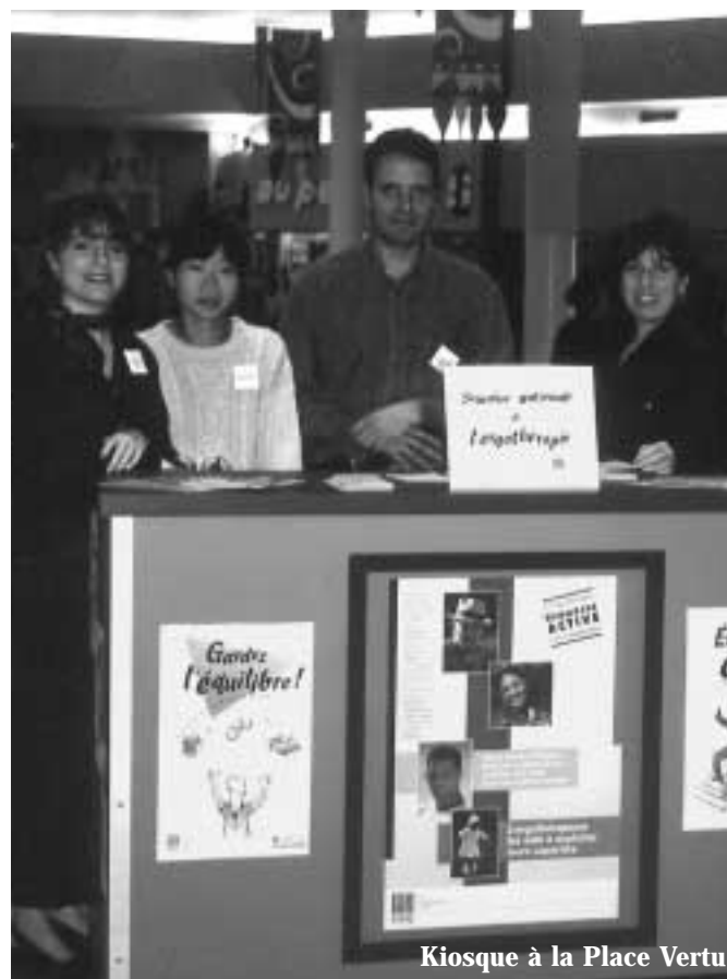
Kiosque à la Place Vertu