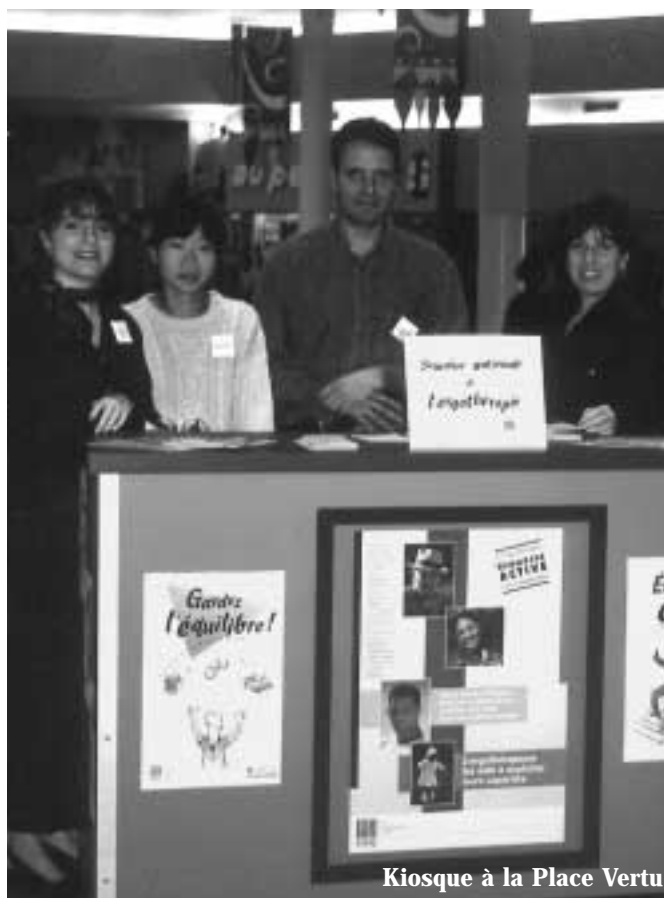
Kiosque à la Place Vertu