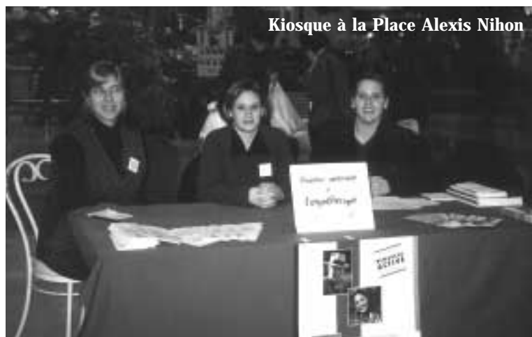
Kiosque à la Place Alexis Nihon