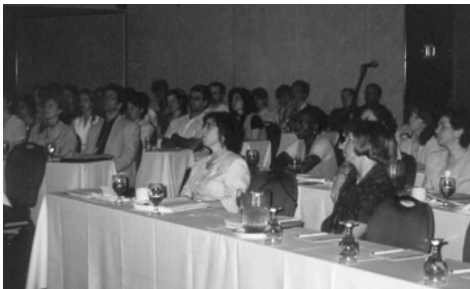
Les participants ont suivi avec intérêt les propos des conférenciers.